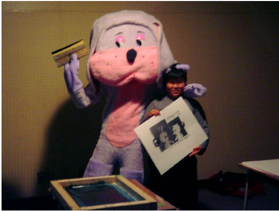
Performance à Sapporo, 2005

Le travail du collectif d'artistes Elshopo s'articule autour de la sérigraphie et du multiple, mais fait aussi intervenir le design, la vidéo, la performance, et même la cuisine, avec un système de sérigraphie sur crêpes présenté en Bretagne en 2005. Par la sérigraphie, Elshopo transmet aussi une utilisation simple et efficace des techniques de l'industrie graphique, offrant par là un moyen excitant pour communiquer dans notre monde d'images. Lors du festival Tokyo Designer Bloc en 2003, Elshopo propose déjà une vision subversive du design, en présentant une machine à sérigraphier patateïde, tel un rocher tombé du ciel à l'ère préhistorique. En 2005, le collectif parcourt pendant 6 mois l'Europe de l'est à bord d'un atelier mobile pour produire des images avec les artistes locaux (Seriall project)... Bref, depuis sa création en 2001 à Grenoble, le collectif est disséminé mais d'autant plus actif, et réalise de nombreuses performances, workshops ou expositions en France et à l'étranger.