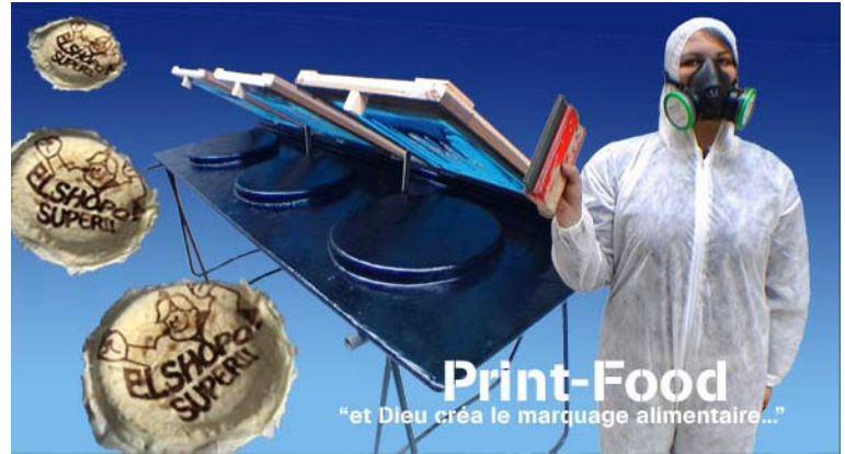
Sérigraphie sur crêpes